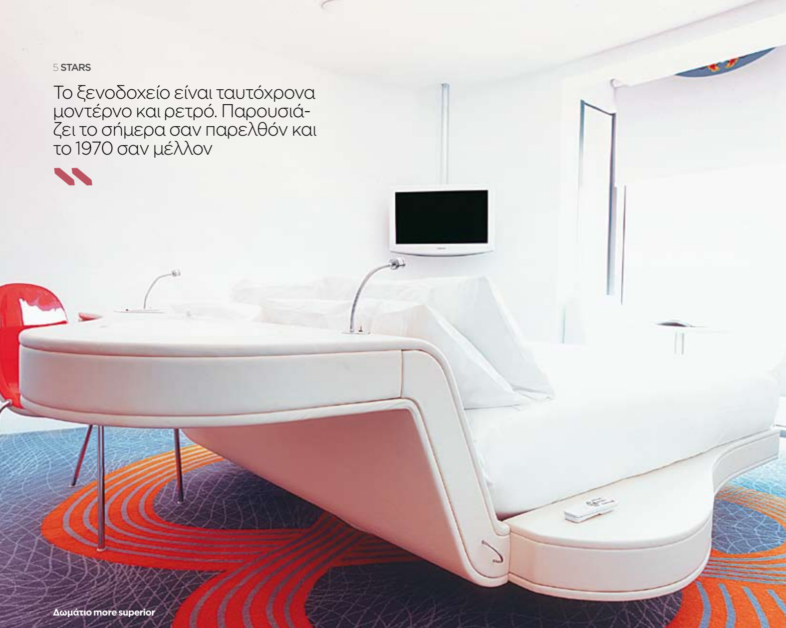
Δωμάτιο more superior

Το ξενοδοχείο είναι ταυτόχρονα μοντέρνο και ρετρό. Παρουσιάζει το σήμερα σαν παρελθόν και το 1970 σαν μέλλον