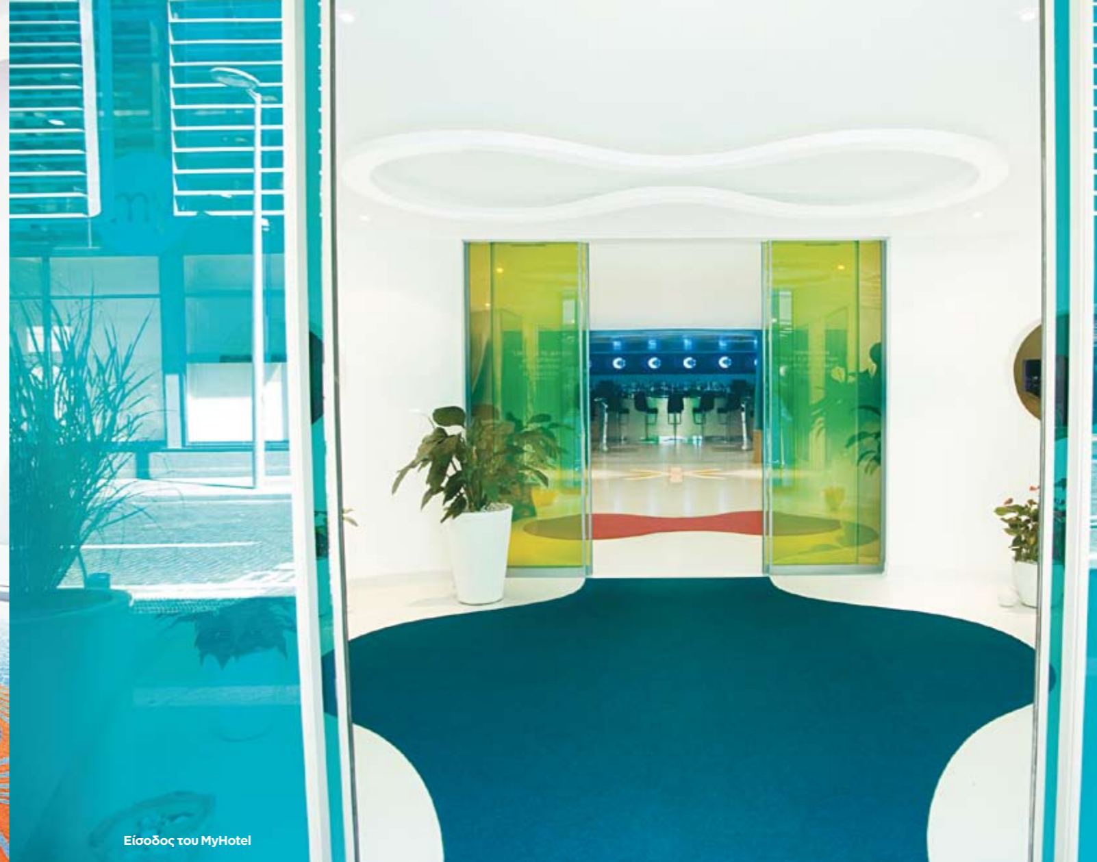
Είσοδος του MyHotel

A ς αφήσουμε πίσω τα ουδέτερα και άχρωμα στίλ των ξενοδοχείων! Ο Αιγυπτιακός καταγωγής βιομηχανικός designer προτείνει για τα νέα boutique hotels ένα σύγχρονο και φανταχτερό ύφος, με εσωτερική διακόσμηση που ξεφεύγει από